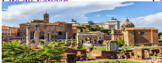
Le Forum Romain