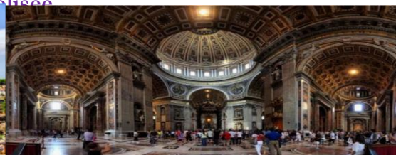
Basilique Saint Pierre