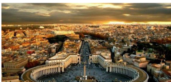
Cité du Vatican