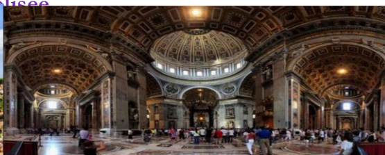
Basilique Saint Pierre