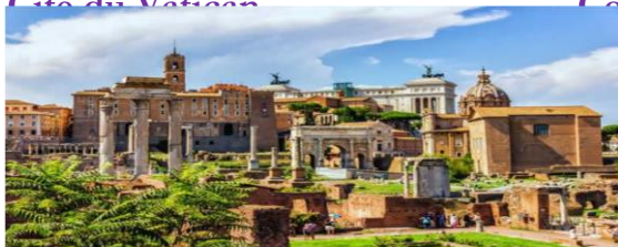
Le Forum Romain