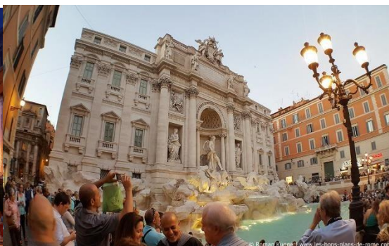
Visiter la fontaine de Trevi à Rome